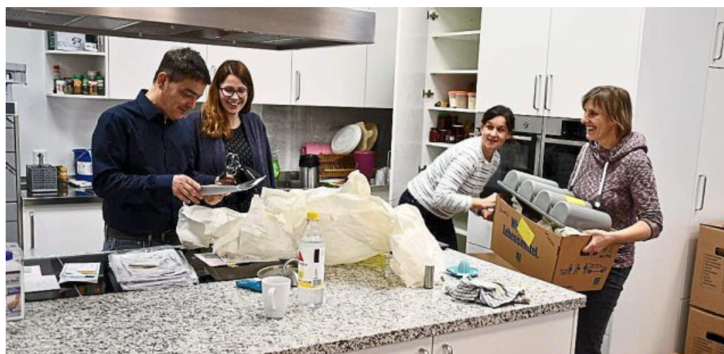
Das Diakonische Werk Bretten hat seine neuen Räumlichkeiten im Dienstleistungszentrum bereits im Januar erfolgreich bezogen.