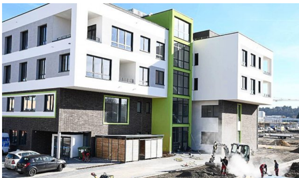
Das Gebäude D des Komplexes gehört zu den beiden Teilen des Baus, die bereits fast komplett fertig sind.